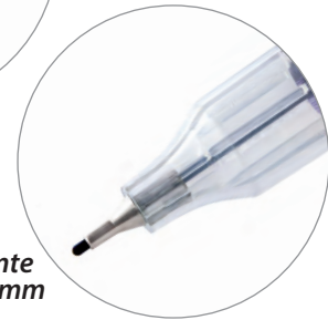
Pointe 0.5 mm