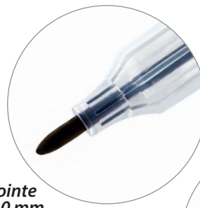
Pointe 1.0 mm

Marqueur simple pointe + règle et 6 étiquettes Conditionnement : boîte de 100