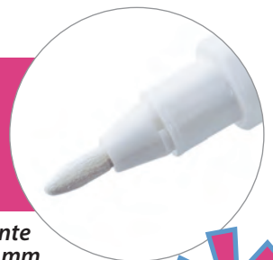
Pointe 1.0 mm