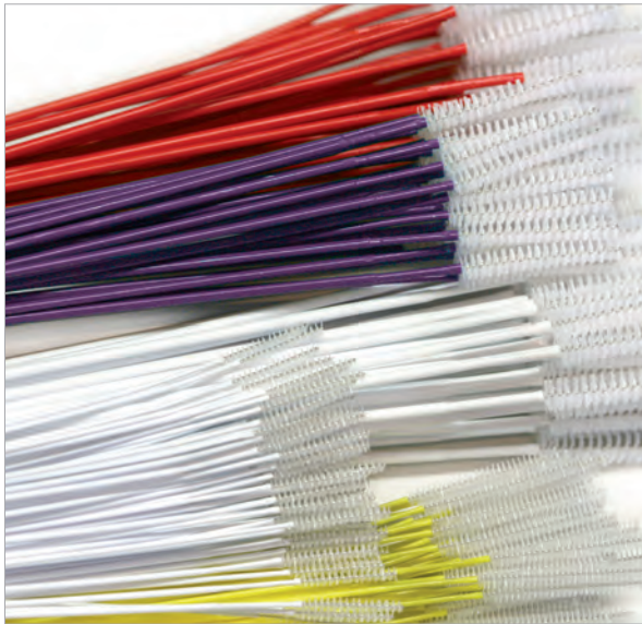
ÉCOUVILLONS SOUPLES USAGE / JOUR UNIQUE, 2 À 5 MM DE DIAMÈTRE