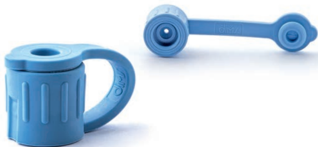
ENCAP01 OLYMPUS® / FUJINON®

Étiquette de traçabilité double et sachet à ouverture facile latérale