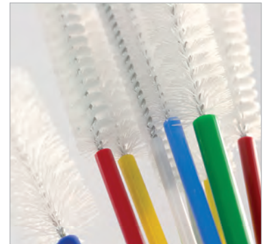
ÉCOUVILLONS SEMI-RIGIDES USAGE / JOUR UNIQUE / 3 À 5.8 MM DE DIAMÈTRE